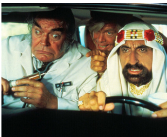
1984 CANNONBALL II (Cannonball Run II) d'Hal Needham avec Doug McClure, Jamie Farr