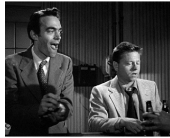
1950 SABLES MOUVANTS (Quicksand) d'Irving Pichel avec