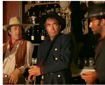
1968 SONORA (Sartana does not forgive) d'Alfonso Balcazar avec Gilbert Roland, George Martin