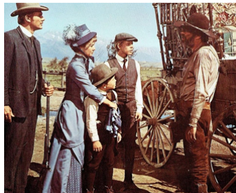
1970 LE PAYS SAUVAGE (The Wild Country) de R. Totten avec S. Forrest, V. Miles, R. Howard