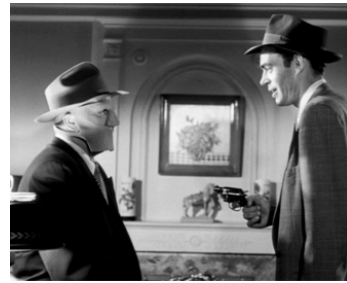
1952 LE QUATRIÈME HOMME (Kansas City Confidential) de Ph. Karlson avec P. Foster