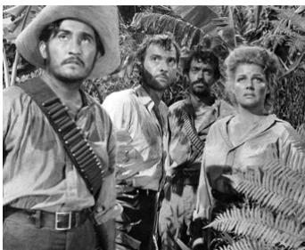
1953 LES RÉVOLTÉS DE LA CLAIRE-LOUISE de J. Tourneur avec Zachary Scott, A. Sheridan