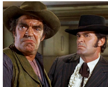
1971 TUEUR MALGRÉ LUI (Support your local Gunfighter) de Burt Kennedy avec J. Garner