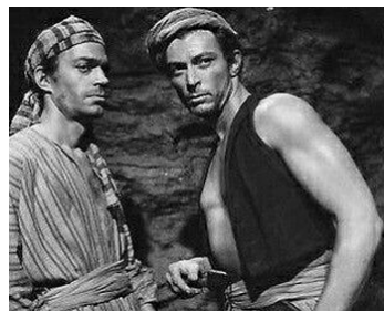
1954 LA PRINCESSE DU NIL (Princess of the Nile) d'Harmon Jones avec Lee Van Cleef