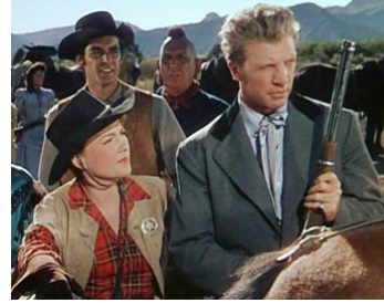
1950 LE PETIT TRAIN DU FAR-WEST (A Ticket to Tomahawk) de R. Sale avec A. Baxter, D. Dailey