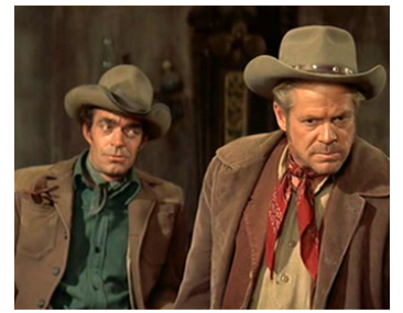
1957 LE SURVIVANT DES MONTS LOINTAINS (Night Passage) de J. Neilson avec Dan Duryea