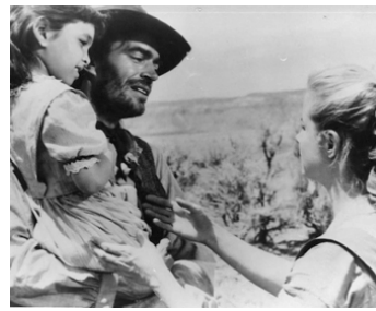
1957 LA POURSUITE FANTASTIQUE (Dragoon Wells Massacre) d'Harold Schuster avec Mona Freeman