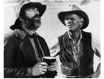
1967 LA ROUTE DE L'OUEST (The Way West) d'Andrew McLaglen avec Richard Widmark