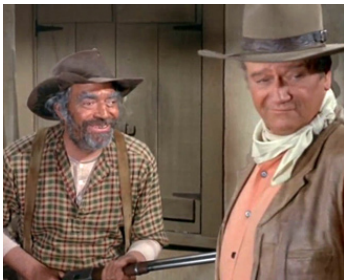
1970 RIO LOBO (Rio Lobo) d'Howard Hawks avec John Wayne