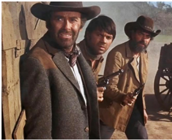
1967 LES CINQ HORS-LA-LOI (Firecreek) de V. McEvety avec H. Fonda, G. Lockwood