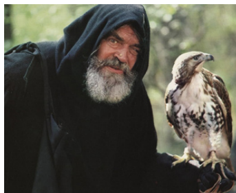
1978 THORVALD LE VIKING (The Norseman) de Charles B. Pierce