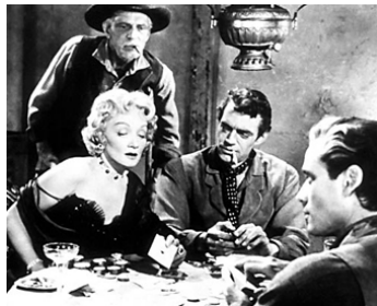
1952 L'ANGE DES MAUDITS (Rancho Notorious) de Fritz Lang avec M. Dietrich, Mel Ferrer