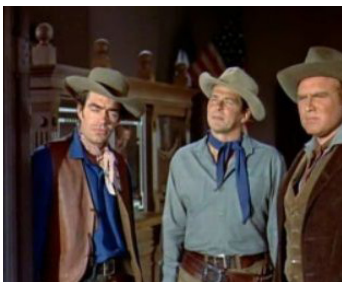
1954 LA REINE DE LA PRAIRIE (Cattle Queen of Montana) d'Allan Dwan avec Ronald Reagan