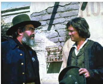
1973 PAT GARRETT ET BILLY LE KID de Sam Peckinpah avec Kris Kristofferson