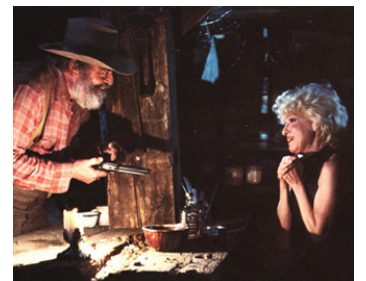
1982 LA FLAMBEUSE DE LAS VEGAS (Jinxed !) de Don Siegel avec Bette Midler