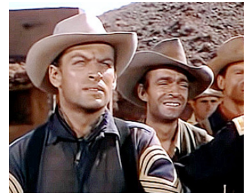
1952 AU MÉPRIS DES LOIS (The Battle at Apache Pass) de George Sherman avec Richard Egan