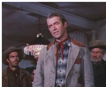
1954 JE SUIS UN AVENTURIER (The Far Country) d'A. Mann avec James Stewart, Jay C. Flippen