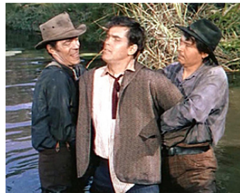
1952 PRISONNIERS DU MARAIS (Lure of the Wilderness) de J. Negulesco avec Jeffrey Hunter