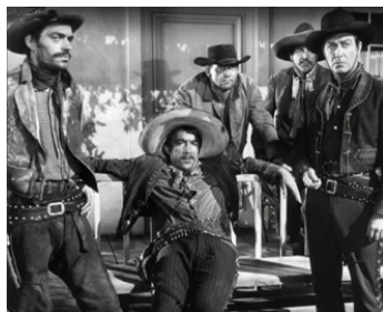
1953 VAQUERO (Ride, Vaquero) de John Farrow avec Anthony Quinn, Robert Taylor