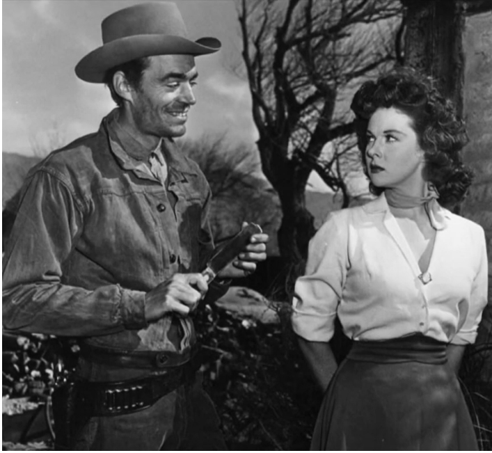
1951 L'ATTAQUE DE LA MALLE-POSTE (Rawhide) d'Henry Hathaway avec Susan Hayward