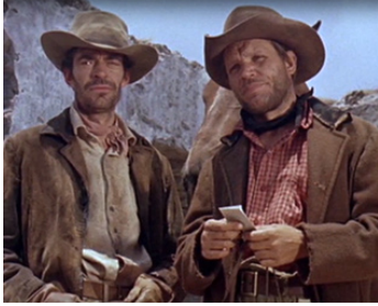
1961 EL PERDIDO (El Perdido) de Robert Aldrich avec Neville Brand