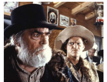
1991 LUCKY LUKE (Lucky Luke) de Terence Hill