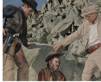
1966 LE PISTOLERO DE LA RIVIÈRE ROUGE (The last Challenge) de R. Thorpe avec G. Ford