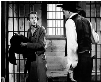
1952 LE TRAIN SIFFLERA 3 FOIS (High Noon) de Fred Zinnemann avec Gary Cooper