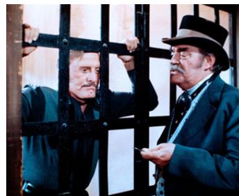
1979 CACTUS JACK (The Villain) d'Hal Needham avec Kirk Douglas