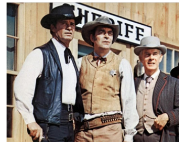
1968 NE TIREZ PAS SUR LE SHÉRIF (Support your local Sheriff) de B. Kennedy avec James Garner