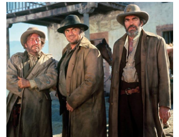
1971 UN COLT POUR 3 SALOPARDS (Hannie Caulder) de B. Kennedy avec Strother Martin, E. Borgnine