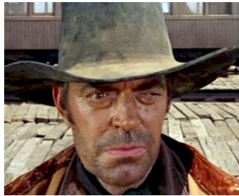
1968 IL ÉTAIT UNE FOIS DANS L'OUEST (C'era una volta il West) de Sergio Leone