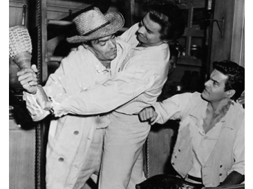
1951 L'OISEAU DE PARADIS (Bird of Paradise) de Delmer Daves avec J. Chandler, L. Jourdan