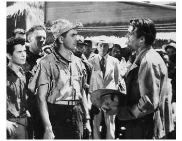
1950 GUÉRILLAS (An American Guerilla in Philippines) de F. Lang avec Tyrone Powe