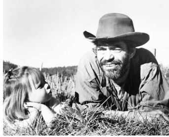
1966 LE RANCH MAUDIT (The Night of the Grizzly) de Joseph Pevney