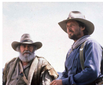
1986 À TRAVERS LES PLAINES SAUVAGES de Burt Kennedy avec Bruce Boxleitner