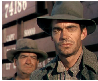
1955 L'HOMME QUI N'A PAS D'ÉTOILE (Man without a Star) de K. Vidor avec G. D. Wallace