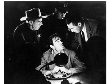
1953 LA DERNIÈRE MINUTE (Count the Hours) de Don Siegel avec Macdonald Carey