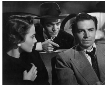
1950 L'IMPASSE MAUDITE (One Way Street) d'Hugo Fregonese avec Marta Toren, J. Mason