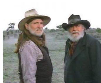
1988 À LA RECHERCHE DE L'OR PERDU (Where the Hell's that Gold) de B. Kennedy avec W. Nelson